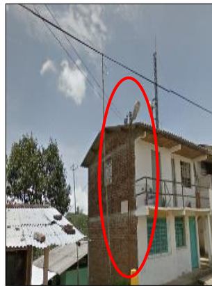
Ilustración 20: luminaria en torrecilla metálica de 4 metros inapropiada por su altura.