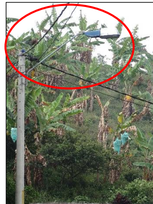
Ilustración 10: luminaria sin vidrio Reflector, Vereda la Oriental.