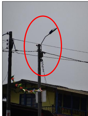
Ilustración 11: luminaria de sodio 70W, con una inter-distancia de 50Metros y un brazo inadecuado que hace que se pierda parte rendimiento.