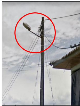
Ilustración 19: luminaria con brazo inapropiado Zona Rural del municipio.