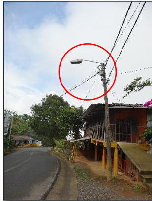
Ilustración 9: luminaria de sodio 150W, Vereda la Oriental.