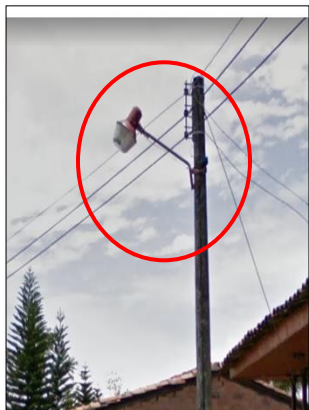
Ilustración 13: luminaria tipo Suburbana en el corregimiento Alto Cauca, las cuales son luminarias inapropiadas para el tipo de vía.