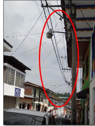
Ilustración 2: luminaria tipo Suburbano, que ya cumplió su vida útil.