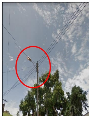
Ilustración 14: luminaria encendida en el corregimiento de Alto Cauca a plena luz del día, consumiendo energía y haciendo más ineficiente el sistema de alumbrado público.