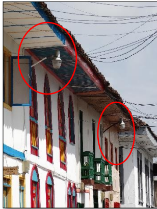
Ilustración 3: luminarias en fachadas con brazos inadecuados que reducen la eficiencia lumínica, luminarias que ya cumplieron con su vida útil.