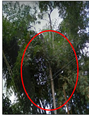
Ilustración 18: luminaria la cual está completamente tapada por los arboles perdiéndose un 80% de su flujo lumínico.