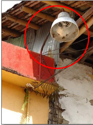
Ilustración 1: Luminaria de sodio en fachada, con brazo inadecuado y con todos sus componentes obsoletos especialmente la carcasa.