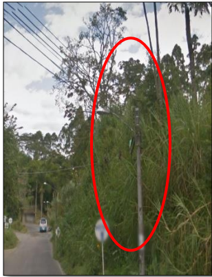
Ilustración 17: luminaria en la salida del municipio hacia Pereira con un brazo muy corto, perdiéndose cubrimiento en la vía del haz de luz.