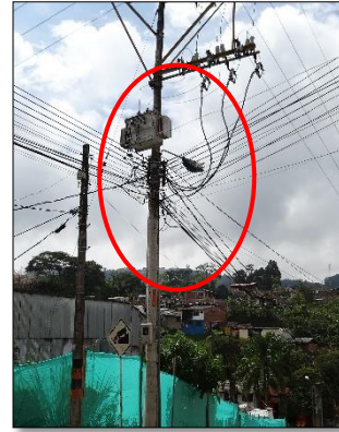
Ilustración 6: luminaria de Sodio 250W mal direccionada hacia un lote en construcción perdiéndose la luminosidad de las vías públicas.