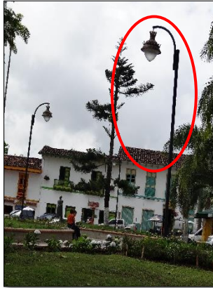
Ilustración 5: luminarias ornamentales parque principal. Con tecnología de Sodio de alto consumo energético Sodio 150W.