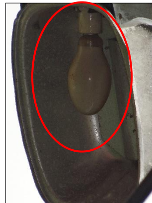
Ilustración 12: luminaria de Mercurio, sin vidrio flector expuesta, poniendo en peligro la comunidad, Vereda el Guayabo.