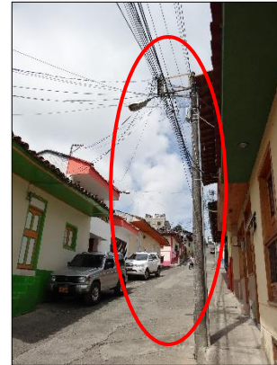
Ilustración 4: luminaria en mal estado sin vidrio reflector, mal direccionada y con brazo inapropiado.