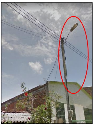
Ilustración 15: luminaria obsoleta por su antigüedad la cual tiene perdidas entre un 20 y 30% en solo sus componentes eléctricos