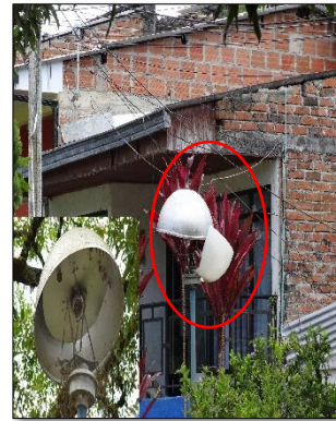
Ilustración 8: luminarias parque con gimnasio al aire libre en mal estado.