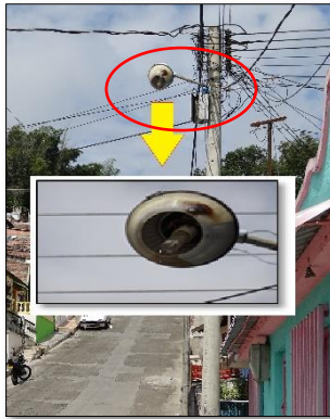
Ilustración 7: luminaria tipo sodio tipo Suburbana mal direccionada, adicional sus componentes son para una bombilla de 70W y tiene una instalada de 150W lo que genero el deterioro de la carcasa.